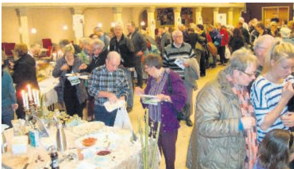
Der bliver en masse at se på - og smage på - ved SmagDjursland Dagen.

Det bliver også spændende at se, hvem der vinder præmierne for de tungeste græskaar. Hver time er der lodtrækning på indgangsbilletten om gode SmagDjursland produkter.